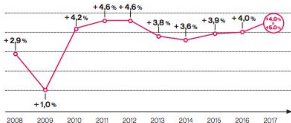
Croissance du marché cosmétique mondial sur 10 ans (2)